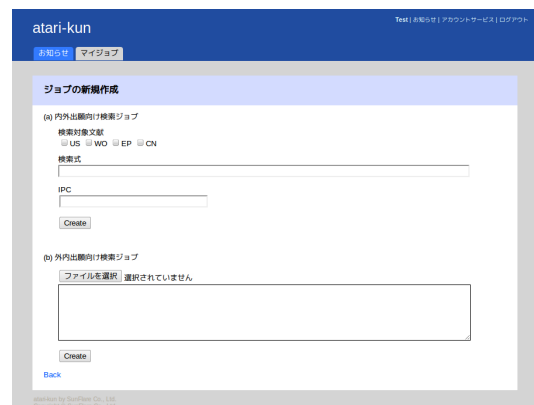
図2 検索ジョブ作成画面の例

外内出願向け検索を行う場合、ユーザーは画面下部にあるフォームを操作して検索ジョブ